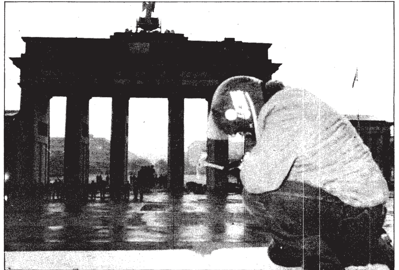
Un joven berlinés golpea simbólicamente con un martillo el muro que ha mantenido hasta ahora dividida la ciudad.

En los cambios del Este, no sólo sorprende su rapidez, sino también que se operen casi sin violencia. Esos totalitarismos, presentados como inquebrantables —y que en ciertos casos aplicaron duras represiones— muestran ahora poca capacidad de resistencia. Mutaciones históricas tienen lugar en medio de manifestaciones de masas enormes, pero prácticamente sin muertos. Ello se explica porque, ante la evidencia de la inoperancia de los sistemas, se ha producido una ruptura profunda dentro de las propias estructuras políticas e ideológicas de los partidos comunistas ac-